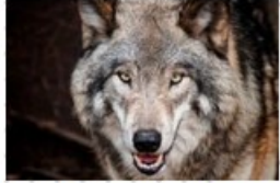
Auslöser - Bewertung